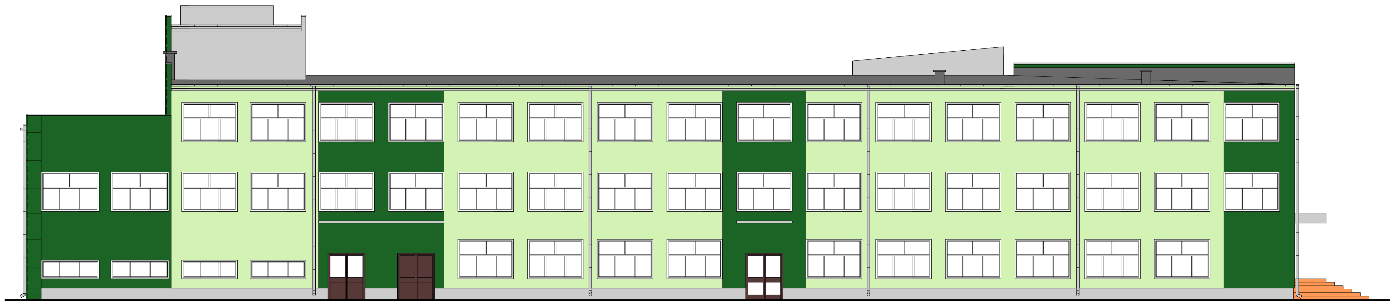
ELEWACJA POŁUDNIOWO-WSCHODNIA SKALA 1:100